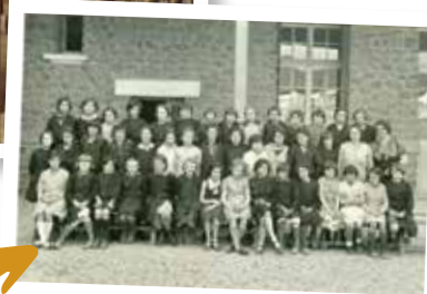
Les filles de l'école Paul Bert dans les années 1930.