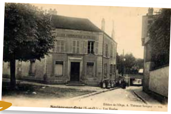
L'école Joséphine. L'école est l'objet de travaux fréquents.