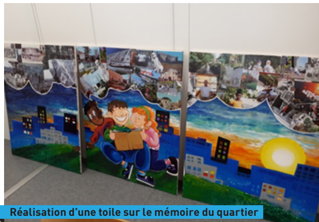
Réalisation d'une toile sur le mémoire du quartier