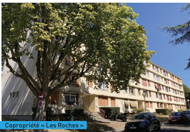
Copropriété « Les Roches »

D'ici fin 2022, chaque copropriété devrait connaître précisément son programme de travaux, son coût et son financement.