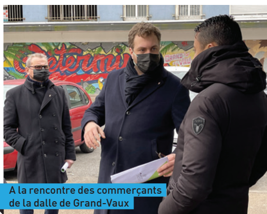
A la rencontre des commerçants de la dalle de Grand-Vaux

Lancée sous forme d'un appel à projet, la dynamique entrepreneuriale des saviniens et des porteurs de projets est mise à l'épreuve pour participer au programme.