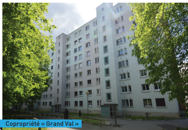
Copropriété « Grand Val »