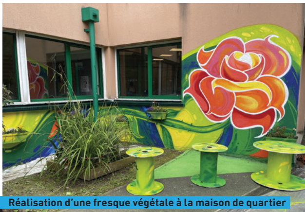
Réalisation d'une fresque végétale à la maison de quartier