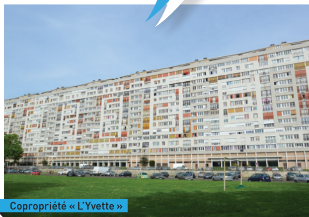
Copropriété « L'Yvette »