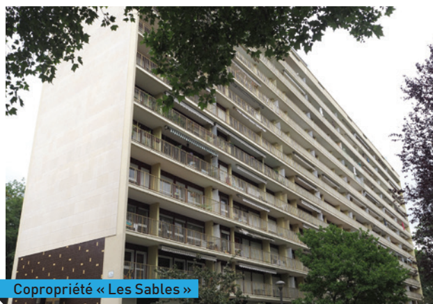
Copropriété « Les Sables »