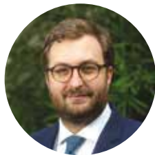
Alexis TEILLET Maire de Savigny-sur-Orge