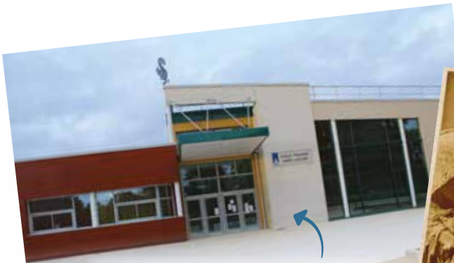
En 2011, la municipalité laisse le choix aux Saviniens : l'école s'appellera Jean-Baptiste Launay - le fondateur de la colonne Vendôme, résidant rue de la Fontaine Blanche à Savigny - ou Aimée Leclerc.

Si le nom de Davout est aussi célèbre à Savigny, c'est autant grâce à la Maréchale qu'à son mari.