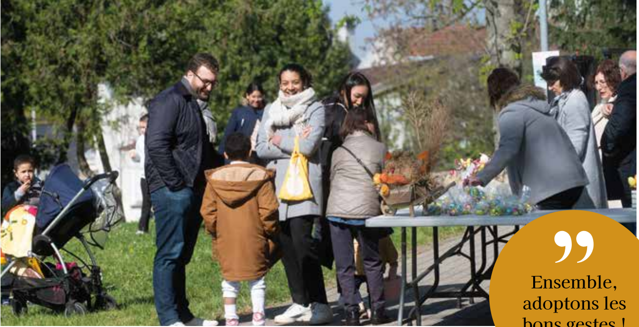
Chasse aux oeufs organisée au parc Séron - 8 avril 2023