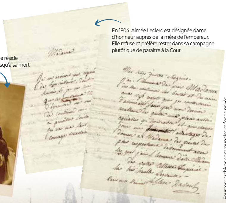
En 1804, Aimée Leclerc est désignée dame d'honneur auprès de la mère de l'empereur. Elle refuse et préfère rester dans sa campagne plutôt que de paraître à la Cour.