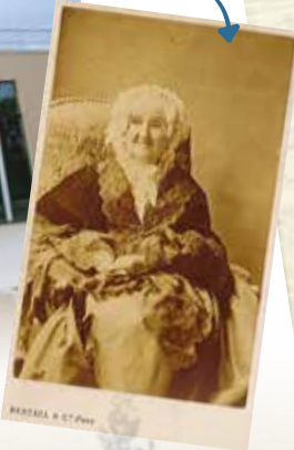
La Maréchale réside à Savigny jusqu'à sa mort en 1868.