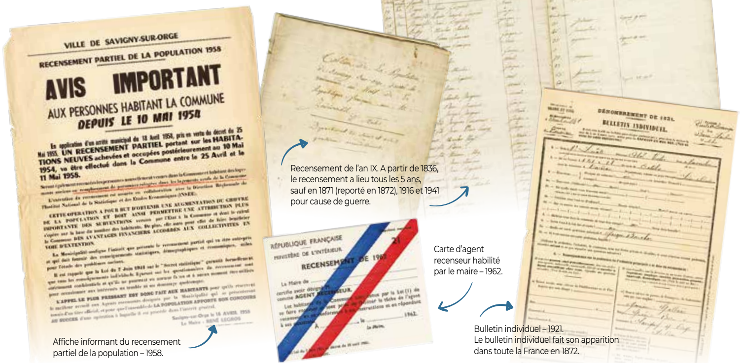
Recensement de l'an IX. A partir de 1836, le recensement a lieu tous les 5 ans, sauf en 1871 (reporté en 1872), 1916 et 1941 pour cause de guerre.

Depuis 2004, les modalités de recensement ont évolué. Pour les communes de plus de 10 000 habitants, on procède à une enquête par sondage auprès d'un échantillon représentant 8% des logements.