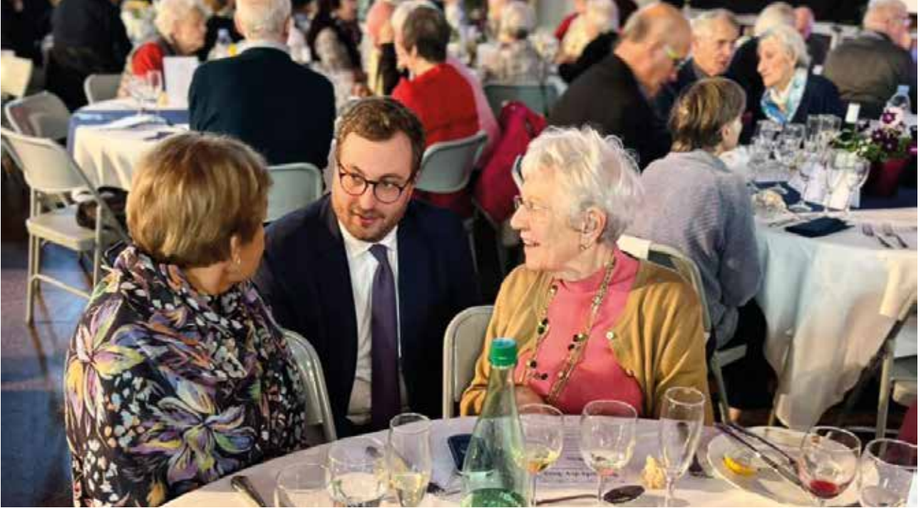
M. le Maire lors du banquet des Aînés en novembre dernier.